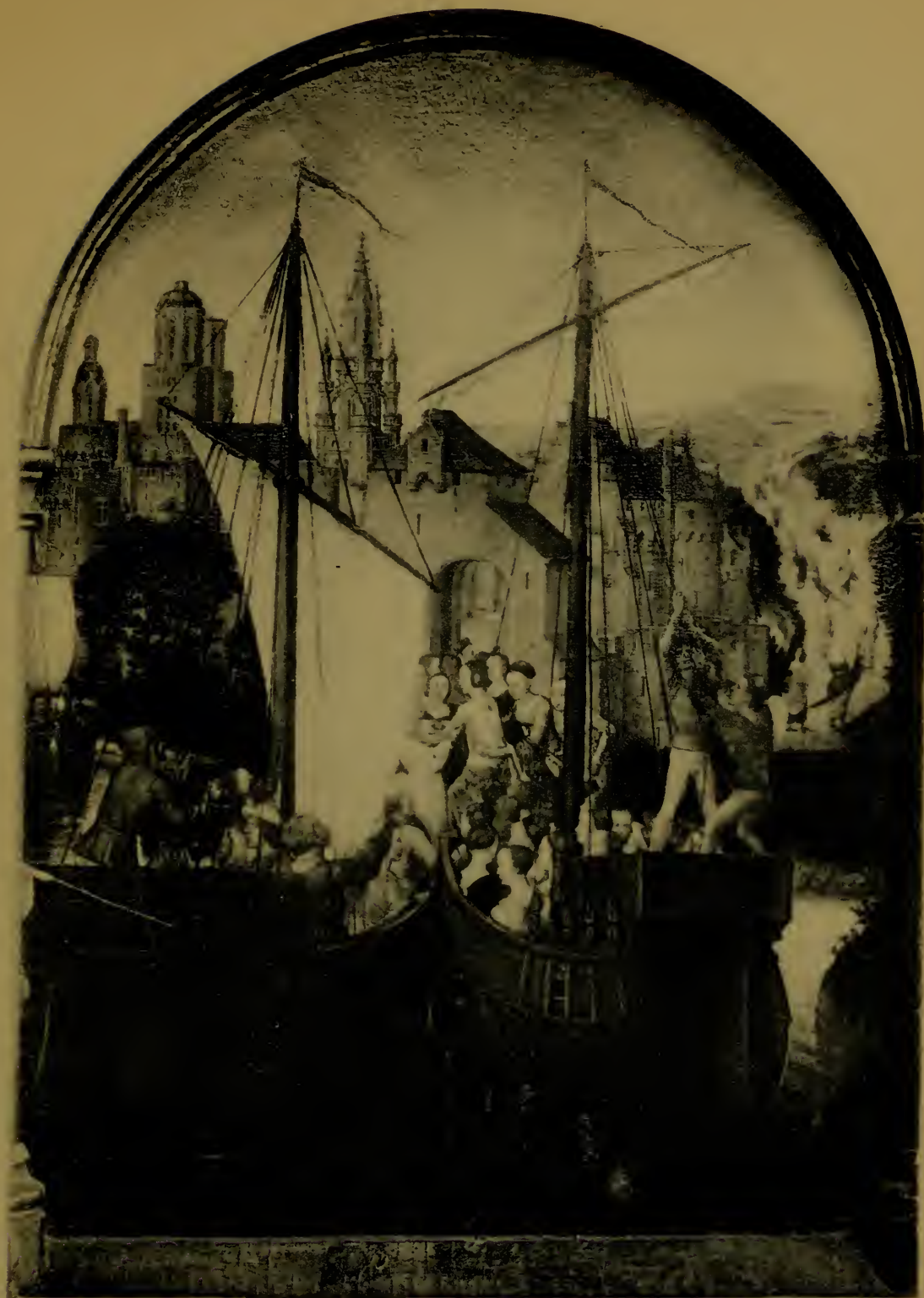
Le débarquement à Bâle Deuxième panneau de la Châsse de Ste-Ursule.